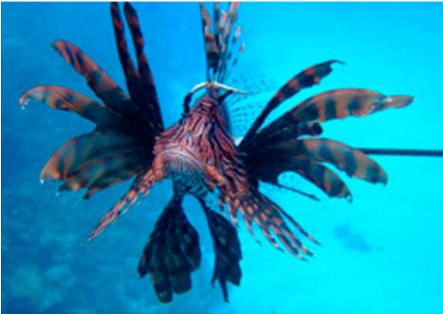
Figura 1. Pez león capturado con arte de pesca en la isla de San Andrés